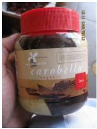
בר קוד: 8711812851941 היצרן: חב' DUD נטודיס הולנד היבואן: חב' "נטורפוד"

לאחרונה, נמצא משווק המוצר "ממרח חרבים" שבתמונה, תוך הצגתו כ"פרווה" משושה K וזאת ללא אישור כשרות מטעם הרבנות הראשית לישראל. אין לקלוט מוצר זה במקומות המושגחים ויש להסיר מוצר זה מהמדפים ולהחזירו ליבואן. בהזדמנות זו נבהיר, כי הגוף משושה K לא הוסמך ליתן תעודת הכשר מטעם מועצת הרבנות הראשית לישראל ועל כן, אין לקלוט תוצרת המסומנת ככשרה באמצעות סמל זה במקומות המושגחים. ידע הציבור וזהרה! (לפרטים נוספים אודות המוצר ומוצרים מיובאים אחרים יש לפנות למח' היבוא ברה"ר בטל' מס' טל': 02-5313137/38).