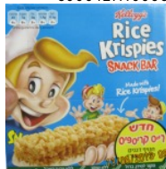
בר קוד רייס קריספייס 5000127770069