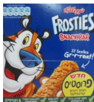
בר קוד פרוסטיס 5000127770065

ממחלקת היבוא נמסר, כי קודי הייצור המופעים ע"ג האריזות בשום אופן לא קיבלו אישור, כך שקיים חשש לכשרות המוצרים. יש להסיר מוצרים אלו מהמדפים ולהחזירם ליבואן. הנהלת הרשות קיבלה הודעה נפרדת במקביל. ידע הציבור יזוהר! (לפרטים נוספים אודות המוצר ומוצרים מיובאים אחרים יש לפנות למח' היבוא ברה"ר בטל' מס' טל': 02-5313137/38).