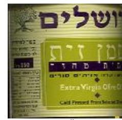
זיוף בד"ץ נוה ציון