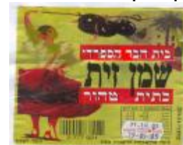
זיוף הרב משה טייר