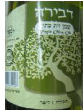
רבנות לכשרות ארצית וחת"ס ב"ב