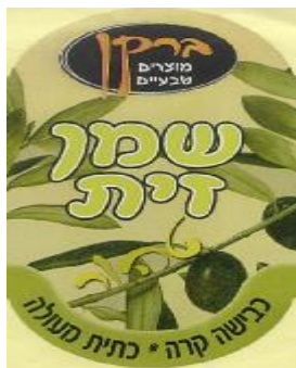
זיוף בד"צ נחלת יצחק