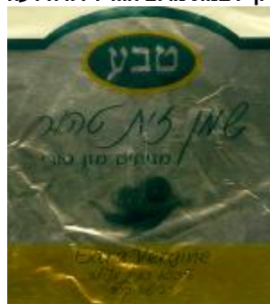
זיוף בד"צ נחלת יצחק