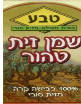
זיוף בד"ץ נחלת יצחק