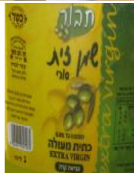
זיוף הרבנות לכשרות ארצית וחוג חת"ס פ"ת