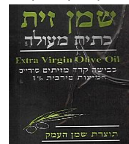
זיוף ה"רבנות לכשרות ארצית"