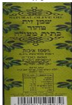
זיוף בד"ץ העדה החרדית י"ם