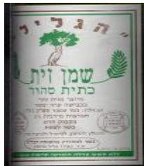
זיוף בד"ץ המכונה "קהילות היראים"