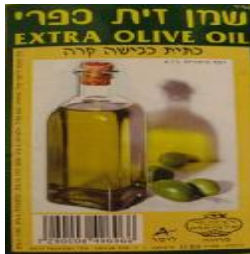
בד"ץ בית יוסף