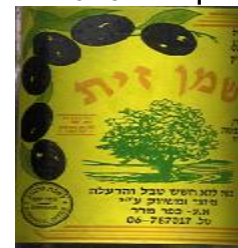
זיוף רבנות זכרון עקב