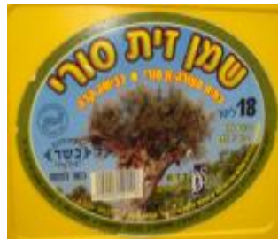
"הרבנות לכשרות ארצית" ובד"צ חוג חת"ס ב"ב

הרבנות לכשרות ארצית בד"ץ יורה דעה (שמון הגון)