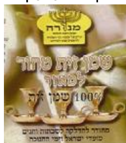
זיוף הרבנות לכשרות ארצית וחוג חת"ס