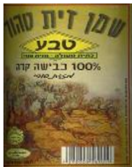
זיוף רבנות עמק לוד ובד"ץ נחלת יצחק