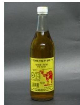
זיוף הרבנות נצרת עילית