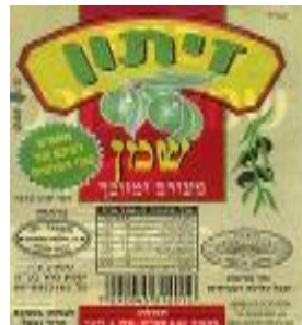
זיוף רבנות מרום הגליל ויורה דעה