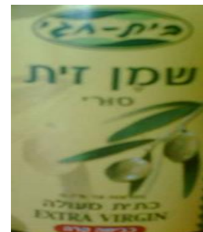
זיוף הרבנות לכשרות ארצית וחוג חת"ס