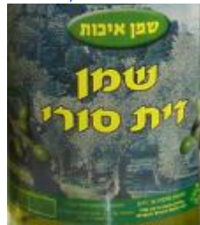
זיוף בד"ץ נחלת יצחק