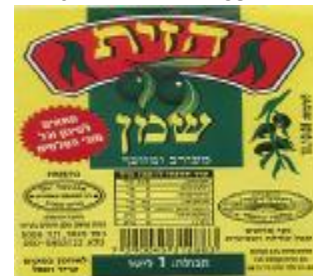
זיוף רבנות מרום הגליל ויורה דעה