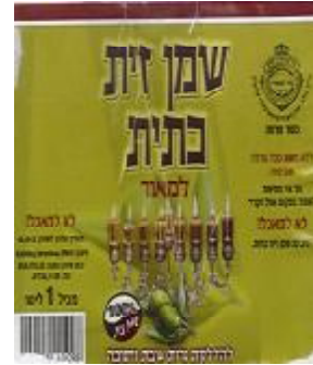
זיוף רבנות מרום הגליל ויורה דעה