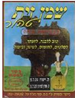
זיוף הרב חיים נבון