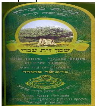
זיוף בד"צ נחלת יצחק