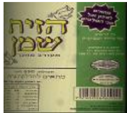
רבנות אזורית מרום הגליל ובד"ץ יורה דעה