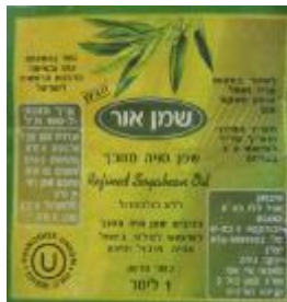
זיוף הרה"ר ישראל זה - או יו