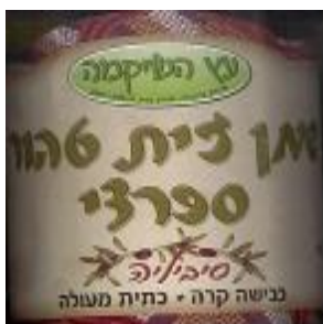
זיוף בד"ץ נחלת יצחק