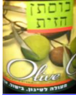
הרב מעטוף חבל מודיעין ובד"צ נחלת יצחק