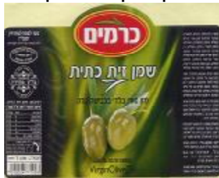
זיוף הרבנות גליל תחתון ובד"ץ מהדרין