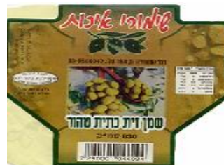
זיוף הרה"ר רחלון