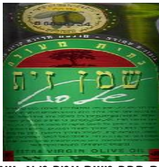
זיוף הרב משה עמר מ.א. יואב

היחידה הארצית לאכיפת חוק איסור הונאה בכשרות