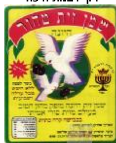
זיוף ועד הכשרות רבנות י"ם