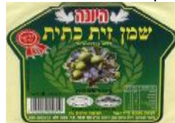
זיוף רבנות מרום הגליל ויורה דעה