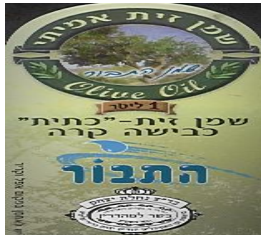
זיוף בד"ץ המכונה "נחלת יצחק"