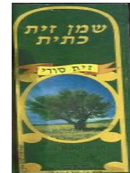
זיוף הרב משה טייר