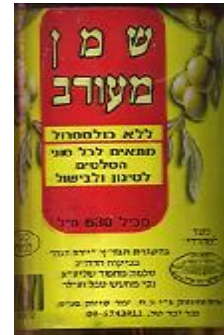
זיוף בד"ץ יורה דעה