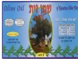
זיוף בד"צ יורה דעה הרבנות לכשרות ארצית