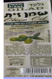
רבנות לכשרות ארצית וחוג חת"ס פ"ת