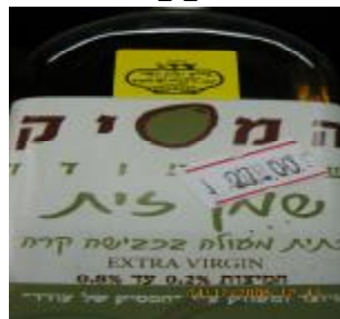
זיוף כשרות ה-O.K ובד"צ "בית יוסף"