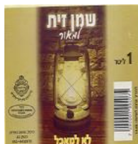
זיוף רבנות עמק לוד ובד"ץ נחלת יצחק