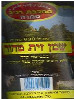
זיוף הרבנות מטה אשר