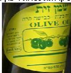
זיוף הרב משה פרץ