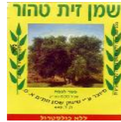
זיוף הרב חיים נבון