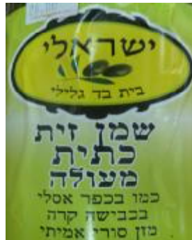
יורה דעה ורבנות לכשרות ארצית