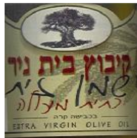
זיוף הרב יצחק אלון