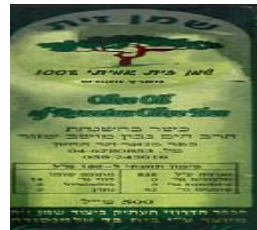
הרב חיים נבון