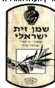
זיוף רבנות טבריא