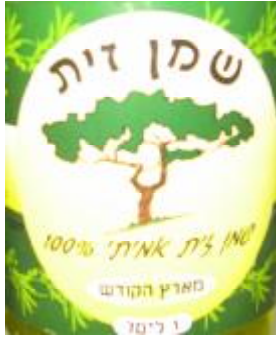
הרב חיים נבון מושב שזור