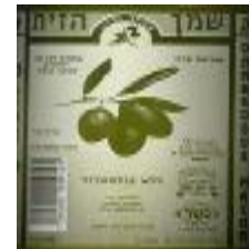
הרבנות לכשרות ארצית חוג חת"ס פ"ת