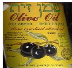
זיוף רבנות חיפה