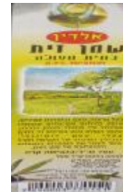
זיוף בד"ץ העדה החרדית י"ם