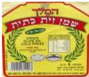
רבנות מרום הגליל ובד"צ יורה דעה הפסיקו לתת כשרות לייצרן זה