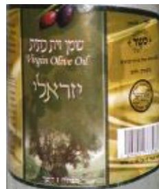
הרבנות לכשרות ארצית וחת"ס בני ברק"