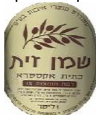
זיוף הרה"ר לישראל