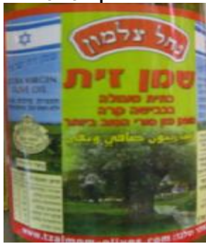
בד"צ נחלת יצחק