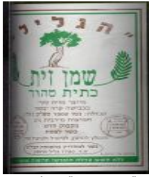
זיוף בד"ץ הממונה "קהילות היראים"