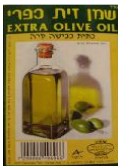
בד"ץ בית יוסף