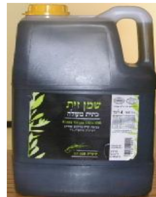
הרבנות לכשרות ארצית בד"ץ יורה דעה (שמן הגן)