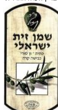
זיוף רבנות טבריא