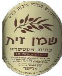
זיוף הרה"ר לישראל