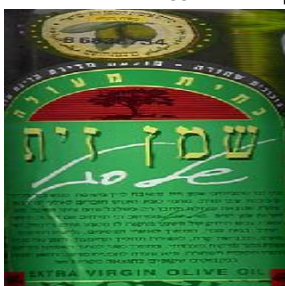
זיוף הרב משה עמר מ.א. יואב