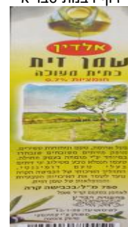
זיוף בד"ץ העדה החרדית י"ם