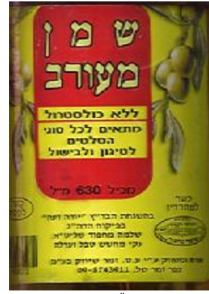
זיף בד"ץ יורה דעה