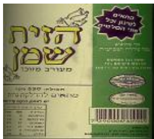
רבנות אזורית מרום הגליל ובד"ץ יורה דעה