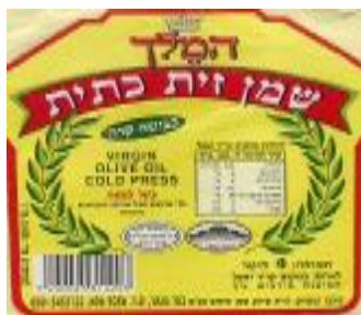
רבנות מרום גולן ובד"ץ יורה דעה הפסיקו לתת כשרות לייצור זה