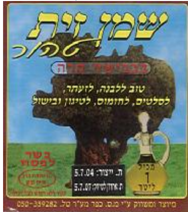
זיף הרב חיים נבון