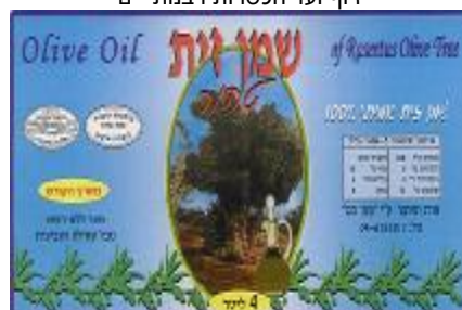
זיוף בד"ץ יורה דעה הרבנות לכשרות ארצית