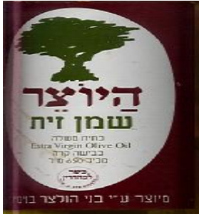
זיוף הרב אונגר