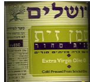
זיוף בד"ץ נוה ציון