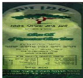
הרב חיים נבון