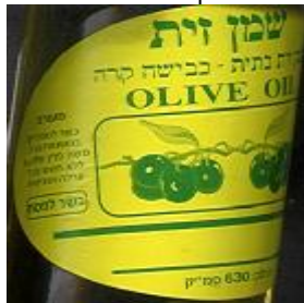
זיוף הרב משה פרץ