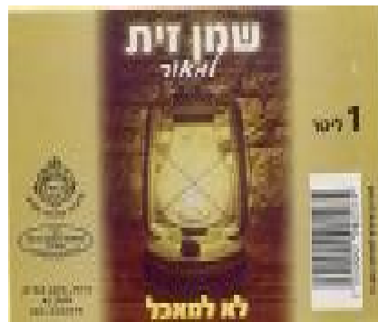
זיוף רבנות עמק לוד ובד"ץ נחלת יצחק