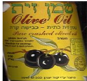
זיוף רבנות חיפה