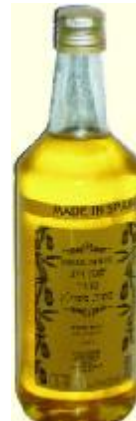
זיוף בד"ץ העדה החרדית י"ם