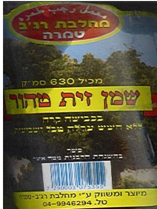
זיף הרבנות מטה אשר