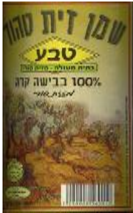
זיוף רבנות עמק לוד ובד"ץ נחלת יצחק

מצ"ב מס' דוגמאות של שמנים מזוייפים אשר נתפסו ע"י פקחי היחידה הארצית - לא כולם מפורטים בטבלה