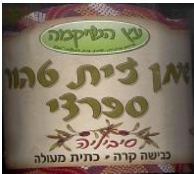
זיוף בד"ץ נחלת יצחק