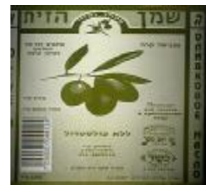
הרבנות לכשרות ארצית חוג חת"ס פ"ת