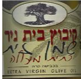
זיוף הרב יצחק אלון