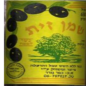
זיוף רבנות זכרון עקב