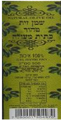
זיוף בד"ץ העדה החרדית י"ם