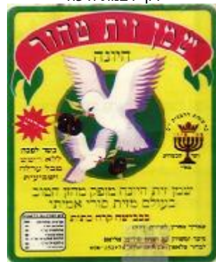
זיוף ועד הכשרות רבנותי"ם