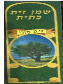
זיוף הרב משה טיירי