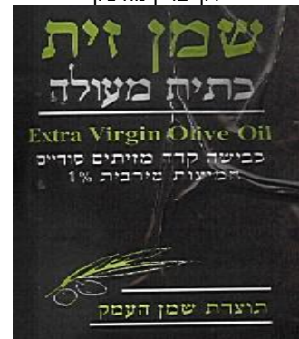
זיוף הרבנות לכשרות ארצית