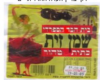
זיוף הרב משה טירי