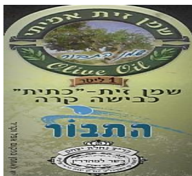
זיוף בד"ץ המכונה "נחלת יצחק"