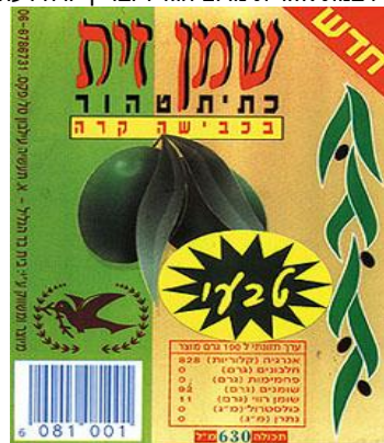
רבנות צפת - "גבעת הזית"