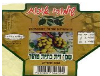
זיוף הרה"ר חולון