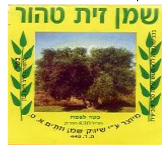
זיוף הרב חיים בנן