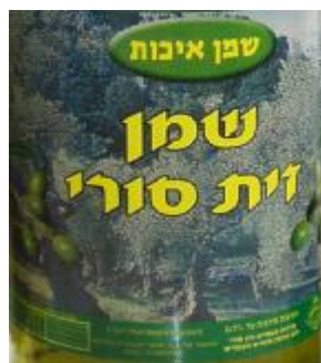
זיוף בד"ץ נחלת יצחק