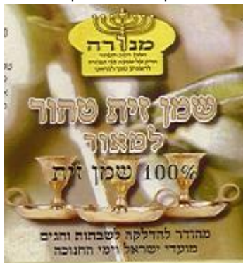
זיוף הרבנות לכשרות ארצית וחוג חת"ס